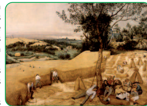
Escena campesina del siglo XVI, en un pintura de Brueghel, del año 1565.

Otro documento de interés para la historia de Briviesca es un pleito de finales de siglo, que se inicia tras el intento de asesinato de un abogado. Este pleito nos muestra cómo un caudillo dirige la villa desde hace veinte años, sin dejar que otro, por honrado que sea, lo haga. Unos testimonios interesantísimos sobre las costumbres políticas de la época que, quizás, podrán recordarnos algo más contemporáneo.