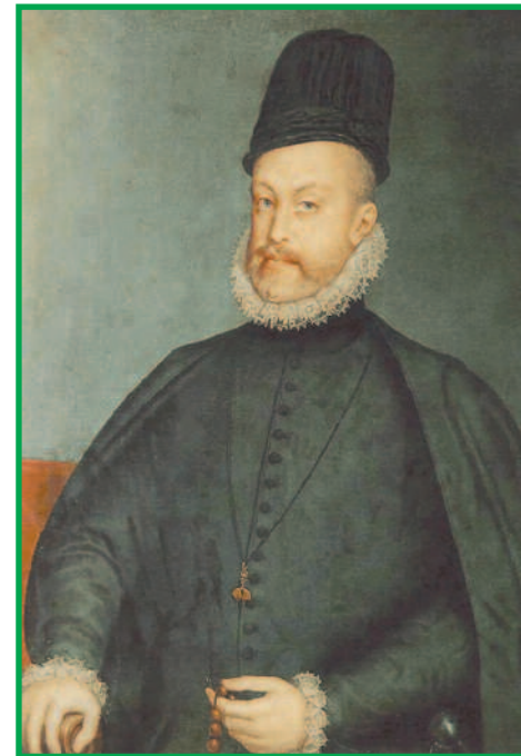
Retrato de Felipe II (1527-1598). Los asuntos financieros le sobrepasaron en varias ocasiones, por lo que la monarquía tuvo que declararse en bancarrota en tres ocasiones: 1560, 1575 y 1596.