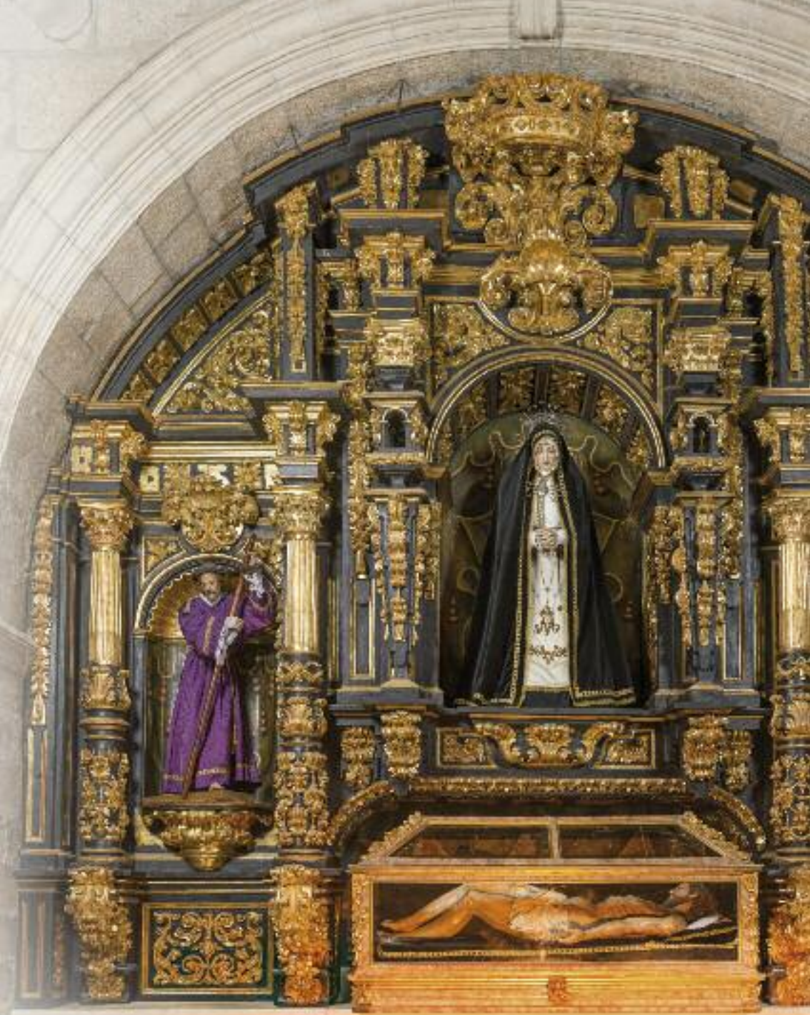
Iglesia de San Martín. Detalle del Retablo. Siglo XVIII.