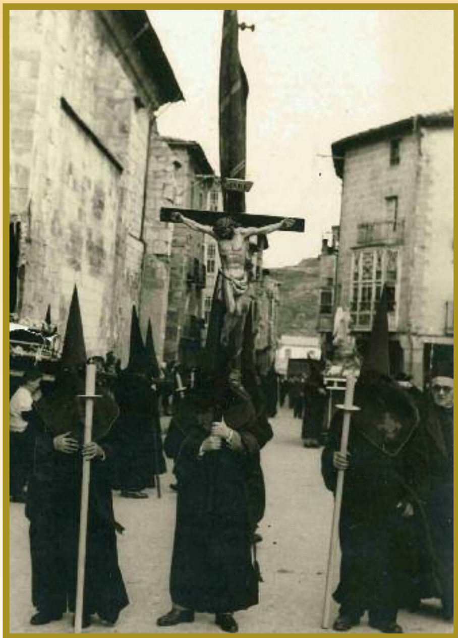
Procesión celebrada año 1950.

Portada: Catafalco Sábado Santo. Cristo Yacente y Virgen Dolorosa.