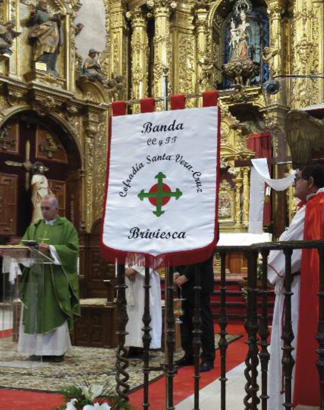
Fotografía: Bendición del nuevo estandarte de la Banda CC y TT. Septiembre 2016

Contraportada: Domingo de Resurrección. Encuentro de Jesús Resucitado con la Virgen de la Alegría